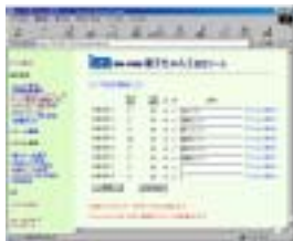
警子ちゃん センサー設定画面

DN-S08P背面の両面テープを監視する装置のランプに貼り付けます。あとはセンサー接続ユニット DN-C02 にコネクタを差込み、DN-C02 と警子ちゃん をコネクタで接続するだけです。